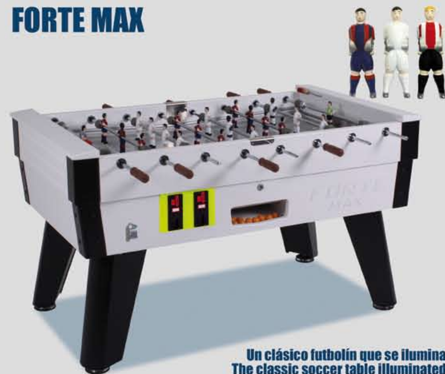
Un clásico fútbol que se ilumina The classic soccer table illuminated