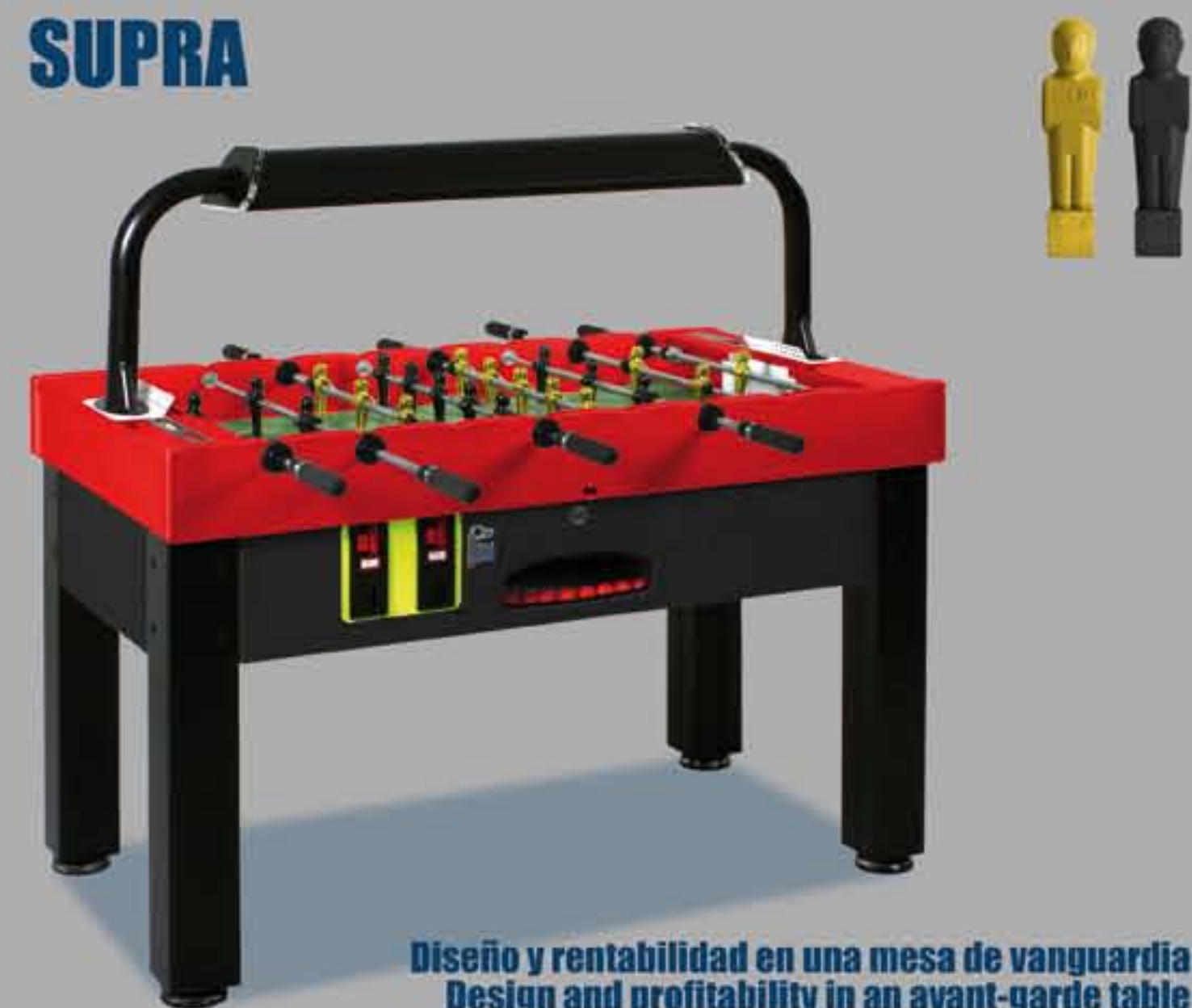
Diseño y rentabilidad en una mesa de vanguardia Design and profitability in an avant-garde table