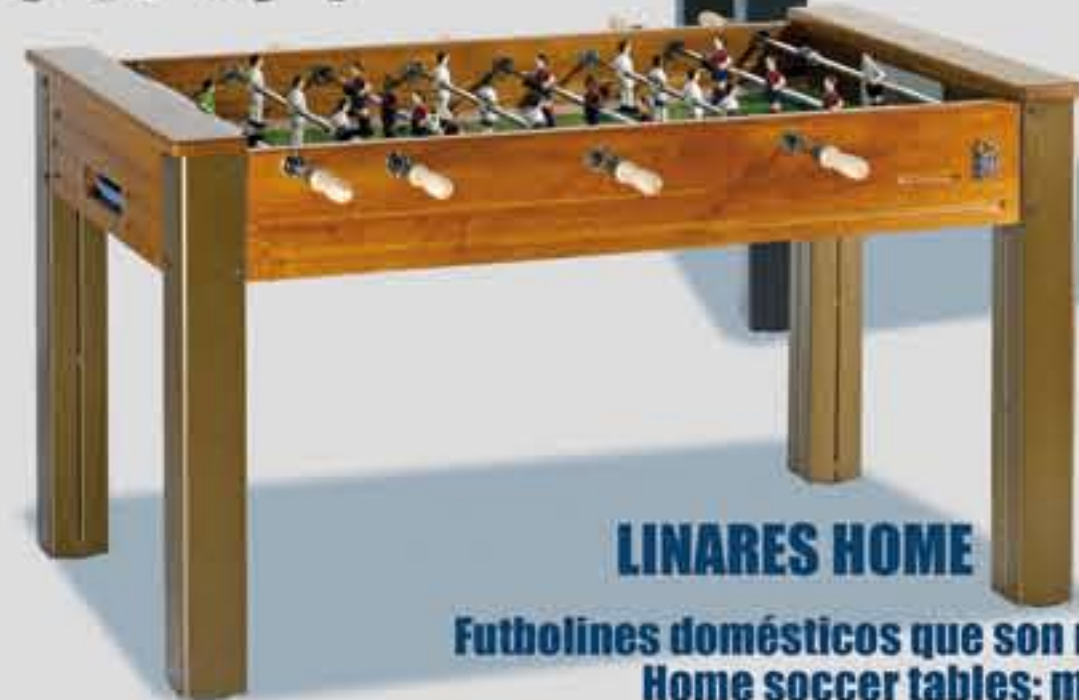
Futbolines domésticos que son más que un juguete Home soccer tables: much more than toys