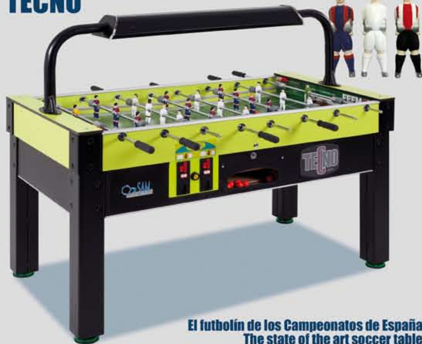
El fútbol de los Campeonatos de España The state of the art soccer table