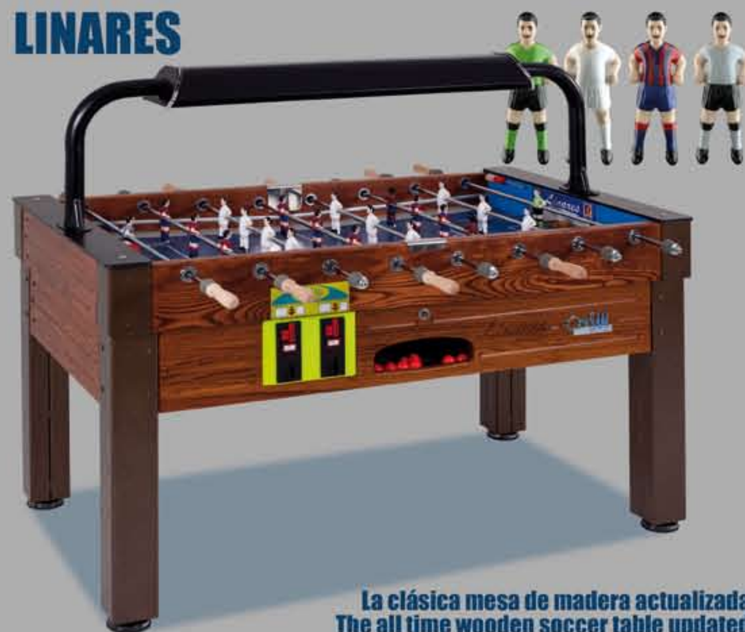
La clásica mesa de madera actualizada The all time wooden soccer table updated